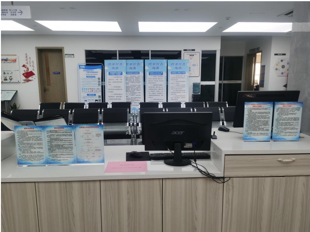
(便民服务中心信息公开查阅点)